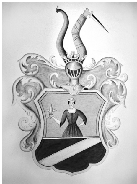
Virginuse suguvõsa aadlivapp. LVVA, 214.6.144a/12, l. 279p, Geschichte des v. Virginischen Geschlechts